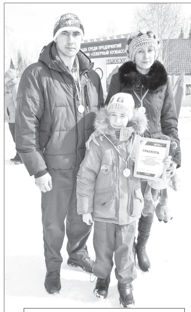
СПОРТИВНАЯ СЕМЬЯ БИКУЛОВЫХ

Елена ТРОФИМОВА