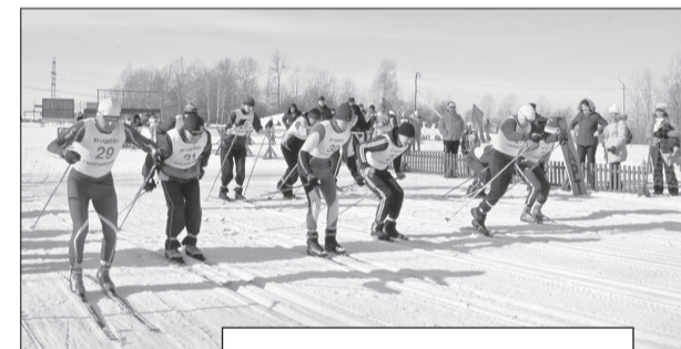
НА СТАРТЕ - МУЖЧИНЫ